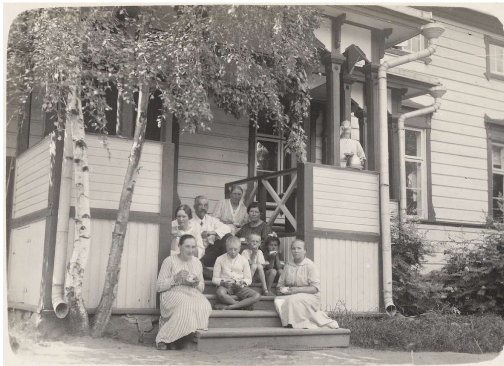
Kuva: Kahvihetki Rautalammin pappilan verannalla; Museoviraston kokoelmat, CC BY 4.0