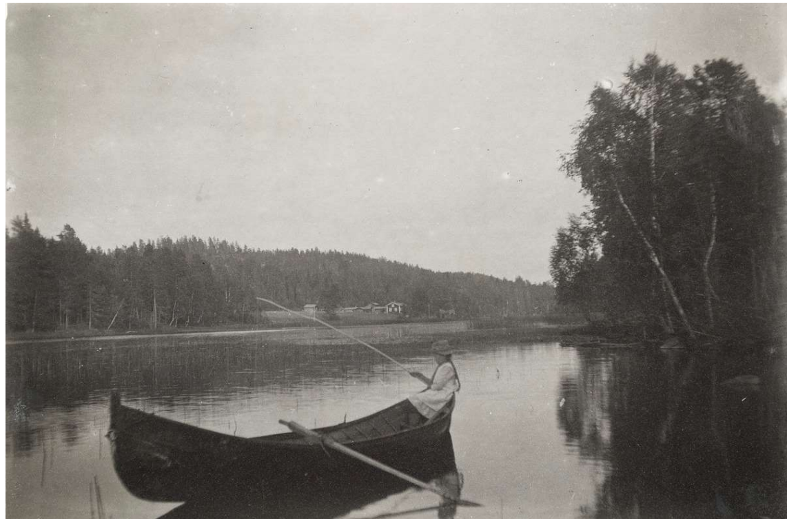
Kuva Rautalammilta: Pieni tyttö kalastaa