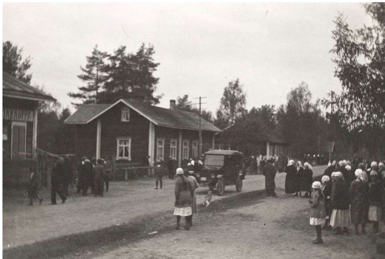
Näkymä Rautalammin kirkonkylältä, kirjakaupan nurkka