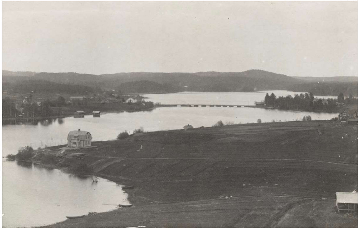
Kuva: Maisema Rautalammita; Museoviraston kokoelmat, CC BY 4.0

KESTÄVÄ KEHITYS JA YMPÄRISTÖN HYVINVOINTI